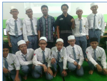
Gambar 1. Kegiatan pengabdian