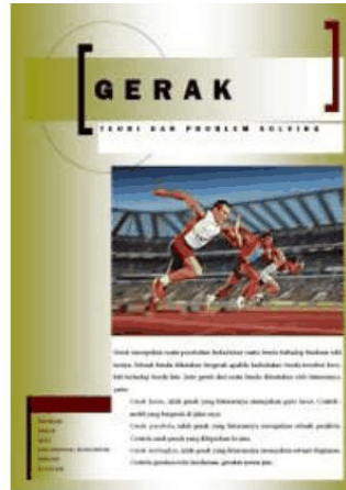
Gambar 4. Cuplikan materi gerak

Materi yang disajikan dalam bahan ajar ini terdiri dari tiga sub bab yaitu Gerak Lurus Beraturan, Gerak Lurus Berubah Beraturan dan Gerak Melingkar, pada akhir bab disajikan materi khusus tentang Persamaan Gerak. Materi dikemas secara ringkas dan padat, setiap sub bab dilengkapi dengan contoh soal dan penyelesaiannya, sehingga melatih mahasiswa untuk terbiasa secara langsung menerapkan teori dan formula untuk menyelesaikan permasalahan.