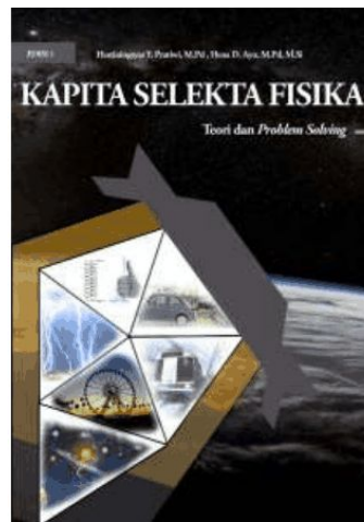
Gambar 2. Cover depan dan bahan ajar

Halaman cover dibuat dengan latar belakang hitam, memuat ilustrasi gambar yang mewakili materi-materi yang ada pada kapita selekta fisika salah satunya adalah materi gerak. Terdapat informasi tentang judul bahan ajar, pengguna bahan ajar, dan penulis bahan ajar.