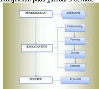
Gambar 3. Flowchart Pembelajaran Problem Solving

Diagram alir ini menggambarkan langkah-langkah pembelajaran problem solving yang disertai dengan pertanyaan Isomorphik problem pairs . Pertanyaan isomorphik diselesaikan menggunakan langkah-langkah pembelajaran problem solving yaitu understanding , planning , solving dan checking . Seperti ditunjukkan pada gambar 3 berikut.