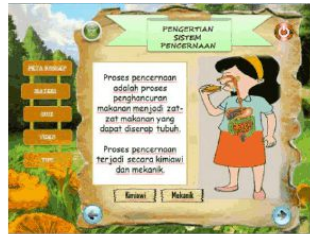
Gambar 2. Halaman Materi