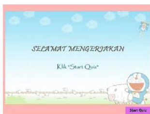
Gambar 3. Halaman Pembuka Quiz

Hasil pengembangan yang telah dilakukan maka peneliti melakukan validasi kepada ahli media dan ahli materi untuk mengetahui kelayakan pada media yang terdiri dari penilaian, saran dan komentar. Hal ini dilakukan sebagai bahan perbaikan media. Penilaian hasil validasi mendapatkan kategori layak yang dapat dilihat pada tabel. Penelitian ini sejalan yang dilakukan Maulani (2016), hasil dari validasi tersebut media pembelajaran dapat digunakan sebagai pendukung dari proses pembelajaran yang bervariasi.