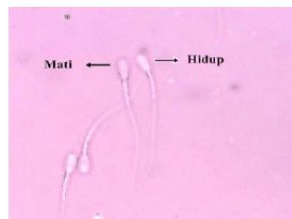
Gambar 1. Viabilitas spermatozoa kambing PE yang diamati menggunakan mikroskop perbesaran 400x

Berdasarkan hasil pengamatan viabilitas setelah pengenceran semen segar kambing PE didapatkan hasil sebesar 95,49 \pm 4,09\% dan setelah pengenceran dan penambahan ekstrak bawang merah didapatkan hasil sebesar 90,63 \pm 0,97\% . Hasil pengamatan menunjukkan adanya penurunan nilai viabilitas setelah dilakukan pengenceran menggunakan Ringer's Dextrose dan penambahan ekstrak bawang merah yang disebabkan oleh pemenuhan kebutuhan nutrisi semen hanya dari glukosa.