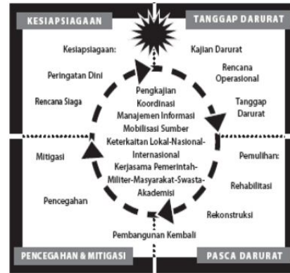
Gambar 2. Siklus Penanggulangan Bencana

Berdasarkan Keputusan Walikota Batu nomor: 180/104/KEP/422.012/2014 tentang meningkatnya status tanggap darurat di Kota Batu karena erupsi Gunungapi Kelud, maka Walikota Batu menetapkan Badan Penanggulangan Bencana Daerah (BPBD) Kota Batu sebagai fungsi koordinasi, pelaksana, dan komando dalam manajemen bencana khususnya tanggap darurat erupsi Gunungapi Kelud. Tanggap darurat menjadi bagian dari penanggulangan bencana yang telah disusun BPBD Kota Batu. Berikut ini siklus penanggulangan bencana.