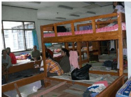
Gambar 5. Kondisi Posko Pengungsian

Bantuan uang, logistik, makanan, pakaian, dan keperluan pendukung lainnya dikoordinasi dengan baik oleh BPBD Kota Batu sebagai pemegang komando tanggap darurat Gunungapi Kelud di Kota Batu. Apresiasi disampaikan oleh Presiden Susilo Bambang Yudhoyono atas keberhasilan Kota Batu dalam penanganan pengungsi. Apresiasi ini diberikan saat kunjungan ke posko pengungsian oleh Presiden dan Ibu Presiden RI ke Kota Batu pada masa krisis Gunungapi Kelud.