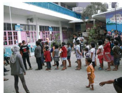
Gambar 7. Aktifitas untuk Pemulihan Pengungsi di Posko Pengungsian

Masa transisi tanggap darurat dilakukan dengan pemenuhan kebutuhan dasar, perlindungan, dan pemulihan para pengungsi. Pemenuhan kebutuhan dasar berupa persediaan logistik dan makanan sehari-hari. Perlindungan dilakukan dengan memberikan posko pengungsian dan pendampingan pencarian keluarga yang hilang. Pemulihan dilakukan dengan memberikan pelayanan kepada pengungsi khususnya anak-anak untuk bisa beradaptasi dengan tempat pengungsian. Tempat-tempat wisata juga memberikan kesempatan bagi para pengungsi untuk menikmati wisata secara gratis. Kegiatan ini bertujuan untuk memberikan hiburan kepada pengungsi pada saat masa darurat Gunungapi Kelud.