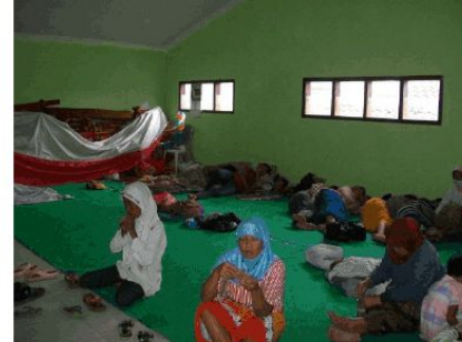
Gambar 6. Kondisi Posko Pengungsian