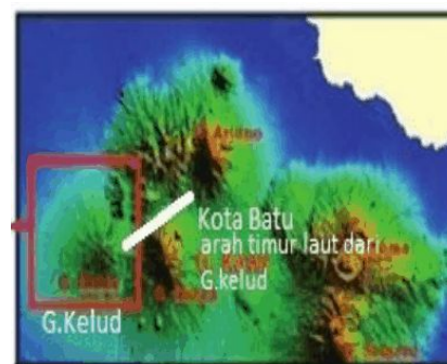
Gambar 1. Morfologi Gunungapi Kelud dilihat dari Citra SRTM

Gunungapi Kelud adalah gunungapi di Provinsi Jawa Timur dengan ketinggian 1.731 m di atas permukaan laut. Gunung ini berada di perbatasan antara Kabupaten Kediri, Kabupaten Blitar, dan Kabupaten Malang. Kemiringan Gunungapi Kelud relatif landai dan kepundannya tidak mengerucut sempurna, tetapi berbukit.