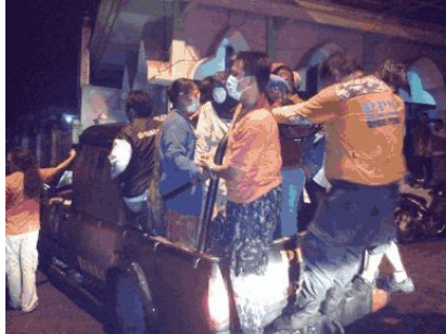
Gambar 4. Proses Evakuasi

Jumlah pengungsi di Kota Batu selama 3 hari masa darurat Gunungapi Kelud mencapai 10.050 penduduk. Semua pengungsi tersebar di 35 titik lokasi pengungsian. Posko pengungsian utama di GOR Ganesha Kota Batu dan didirikan dapur umum di posko ini. 34 posko yang lain tetap di bawah koordinasi posko GOR Ganesha.