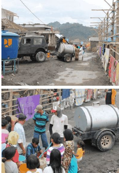
Gambar 8. Bantuan Air Bersih di Lokasi Terdampak