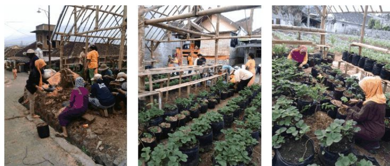
Gambar 3. Aktifitas KWT dalam Budidaya Stroberi pada Greenhouse dengan Sistem Rak Berundak (2017)