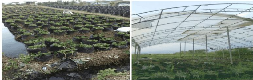
Gambar 1. Kiri: Budidaya Stroberi pada Lahan Terbuka (KWT Rajak Berseri) Kanan: Budidaya Stroberi dengan Greenhouse (KWT Melati Putri)

KWT Rajak Berseri dan KWT Melati Putri dijadikan sebagai mitra pengabdian pada masyarakat. Kedua kelompok tani ini memiliki persamaan dalam budidaya stroberi yakni sistem polybag . Namun, perbedaan keduanya yaitu pada sistem greenhouse . KWT Rajak Berseri membudidayakan stroberi dengan sistem polybag pada lahan terbuka, sedangkan KWT Melati Putri dengan sistem polybag pada greenhouse .