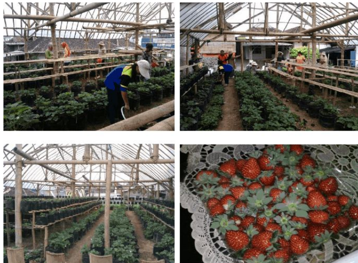
Gambar 4. Hasil Produktifitas Stroberi pada Greenhouse dengan Sistem Rak Berudak (2017)

Seminar Nasional Hasil Pengabdian kepada Masyarakat 2017