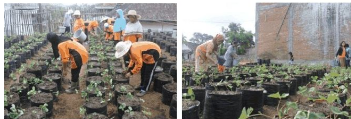
Gambar 2. Aktifitas KWT dalam Budidaya Stroberi pada Lahan Terbuka (2016)

Kedua KWT ini memiliki permasalahan yang sama dalam budidaya stroberi, yaitu: 1) minimnya pengetahuan dan pemahaman tentang teknik budidaya stroberi; 2) belum bisa membedakan pemilihan bibit yang bagus atau tidak. Kedua permasalahan ini diperlukan solusi dalam bentuk pelatihan budidaya stroberi. Pelatihan ini mendatangkan pemateri dari Tim Balai Penelitian Jeruk dan Buah Sutropika (Balitjestro) Kota Batu. Antusiasme KWT sangat terlihat dari peran aktif anggota saat proses pelatihan dan praktik langsung budidaya stroberi.