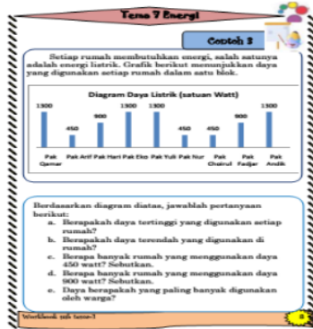
Gambar 1. Contoh soal pada workbook

faat. Berikut adalah salah satu tampilan workbook yang digunakan dalam penelitian ini.