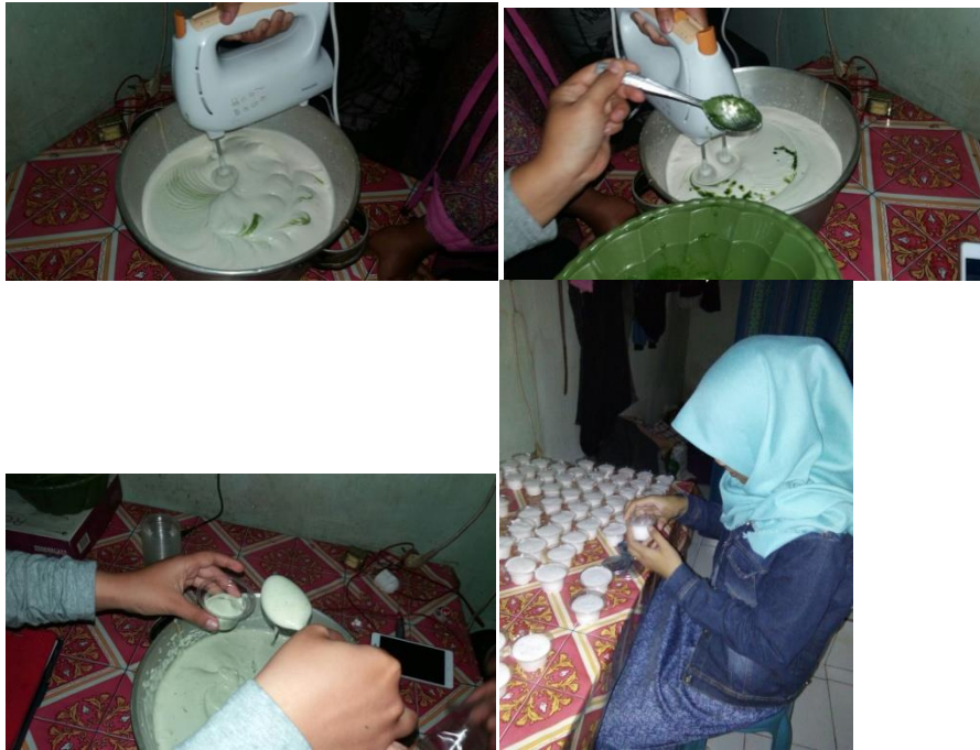
Gambar 3.2. Foto-foto pembuatan Soreo Ice Cream