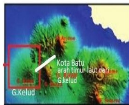
5 Gambar 1. Morfologi Gunungapi Kelud dilihat dari Citra SRTM

Gunungapi Kelud adalah gunungapi di Provinsi Jawa Timur dengan ketinggian 1431 m di atas permukaan laut. Gunung ini berada di perbatasan antara Kabupaten Kediri, Kabupaten Blitar, dan Kabupaten Malang. Kemiringan Gunungapi Kelud relatif landai dan kepundannya tidak mengerucut sempurna, tetapi berbukit.