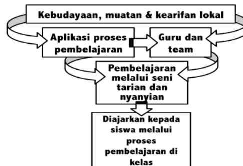
Gambar 2. Strategi dan Proses Integrasi Kearifan Lokal

Rangkaian proses mengintegrasikan kearifan lokal dalam proses pembelajaran oleh guru di kelas, diawali dengan mengidentifikasi dan menganalisis muatan lokal yang ada. Dari muatan lokal yang ada, kemudian diterjemahkan dan aplikasi proses pembelajaran yang bisa dilaksanakan oleh guru dalam kelas seperti kebudayaan dan seni. Kearifan lokal yang ada diterjemahkan sebagai kegiatan seni dan budaya yang dapat dilaksanakan melalui kegiatan-kegiatan yang bernuansa kebudayaan seperti tarian dan nyanyian. Dalam menterjemahkan muatan lokal, guru-guru dibantu oleh team di sekolah, terutama untuk perencanaan kegiatan yang akan dilaksanakan oleh guru. Monitoring dan evaluasi yang dilaksanakan oleh guru dalam menentukan kegiatan yang bernuansa muatan lokal dilaksanakan saat pembahasan sampai dengan menyusun perencanaan kegiatan pembelajaran. Rangkaian proses tersebut dapat dilihat pada gambar berikut: