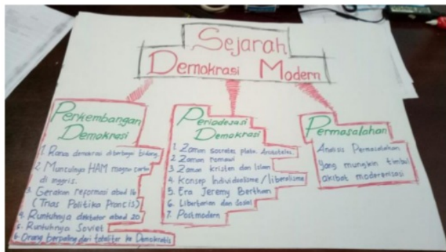
Gambar 3. Contoh Lesson Design Siklus 2

Pada siklus 1 , pelaksanaan untuk diskusi berlangsung pasif dan mahasiswa masih kurang menguasai materi. Beberapa mahasiswa datang terlambat dan teamwork yang dilaksanakan di kelas juga berjalan kurang baik dengan mahasiswa yang diidentifikasi sebagai aktifis yang lebih menguasai diskusi di kelas. Perlu pembenahan pada aspek perencanaan dengan mengedepankan clue yang lebih update dan bahan diskusi yang lebih mudah dicerna dibandingkan dengan bahan Teori Demokrasi Klasik. Observer banyak memberikan kelemahan-kelemahan, terutama sektor perencanaan, dan intervensi dosen dalam pelaksanaan diskusi.