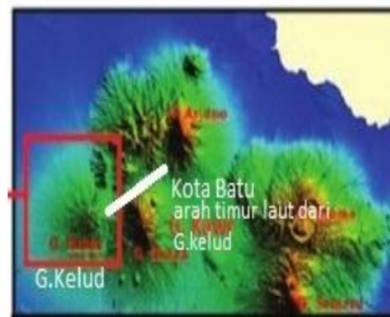
Gambar 1. Morfologi Gunungapi Kelud dilihat dari Citra SRTM

Gunungapi Kelud adalah gunungapi di Provinsi Jawa Timur dengan ketinggian 1.731 m di atas permukaan laut. Gunung ini berada di perbatasan antara Kabupaten Kediri, Kabupaten Blitar, dan Kabupaten Malang. Kemiringan Gunungapi Kelud relatif landai dan kepundannya tidak mengerucut sempurna, tetapi berbukit.