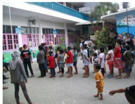
Gambar 7. Aktifitas untuk Pemulihan Pengungsi di Posko Pengungsian

3) Transisi Tanggap Darurat Masa transisi tanggap darurat dilakukan dengan pemenuhan kebutuhan dasar, perlindungan, dan pemulihan para pengungsi. Pemenuhan kebutuhan dasar berupa persediaan logistik dan makanan sehari-hari. Perlindungan dilakukan dengan memberikan posko pengungsian dan pendampingan pencarian keluarga yang hilang. Pemulihan dilakukan dengan memberikan pelayanan kepada pengungsi khususnya anak-anak untuk bisa beradaptasi dengan tempat pengungsian. Tempat-tempat wisata juga memberikan kesempatan bagi para pengungsi untuk menikmati wisata secara gratis. Kegiatan ini bertujuan untuk memberikan hiburan kepada pengungsi pada saat masa darurat Gunungapi Kelud.