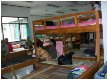
Gambar 5. Kondisi Posko Pengungsian

Bantuan uang, logistik, makanan, pakaian, dan keperluan pendukung lainnya dikoordinasi dengan baik oleh BPBD Kota Batu sebagai pemegang komando tanggap darurat Gunungapi Kelud di Kota Batu. Apresiasi disampaikan oleh Presiden Susilo Bambang Yudhoyono atas keberhasilan Kota Batu dalam penanganan pengungsi. Apresiasi ini diberikan saat kunjungan ke posko pengungsian oleh Presiden dan Ibu Presiden RI ke Kota Batu pada masa krisis Gunungapi Kelud.