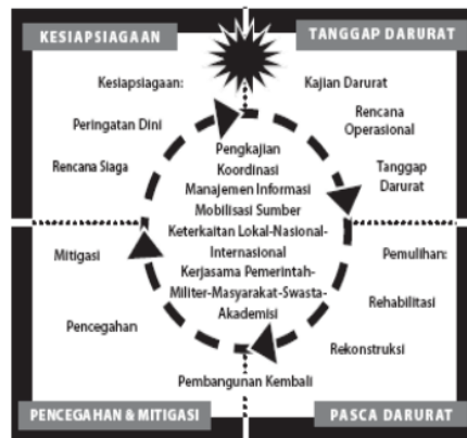
Gambar 2. Siklus Penanggulangan Bencana

Berdasarkan Keputusan Walikota Batu nomor: 180/104/KEP/422.012/2014 tentang meningkatnya status tanggap darurat di Kota Batu karena erupsi Gunungapi Kelud, maka Walikota Batu menetapkan Badan Penanggulangan Bencana Daerah (BPBD) Kota Batu sebagai fungsi koordinasi, pelaksana, dan komando dalam manajemen bencana khususnya tanggap darurat erupsi Gunungapi Kelud. Tanggap darurat menjadi bagian dari penanggulangan bencana yang telah disusun BPBD Kota Batu. Berikut ini siklus penanggulangan bencana.