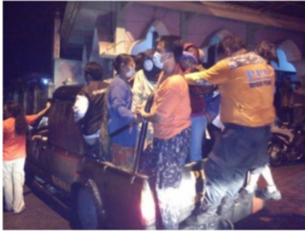
Gambar 4. Proses Evakuasi

Jumlah pengungsi di Kota Batu selama 3 hari masa darurat Gunungapi Kelud mencapai 10.050 penduduk. Semua pengungsi tersebar di 35 titik lokasi pengungsian. Posko pengungsian utama di GOR Ganesha Kota Batu dan didirikan dapur umum di posko ini. 34 posko yang lain tetap di bawah koordinasi posko GOR Ganesha.