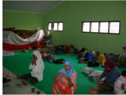
Gambar 6. Kondisi Posko Pengungsian

3) Transisi Tanggap Darurat Masa transisi tanggap darurat dilakukan dengan pemenuhan kebutuhan dasar, perlindungan, dan pemulihan para pengungsi. Pemenuhan kebutuhan dasar berupa persediaan logistik dan makanan sehari-hari. Perlindungan dilakukan dengan memberikan posko pengungsian dan pendampingan pencarian keluarga yang hilang. Pemulihan dilakukan dengan memberikan pelayanan kepada pengungsi khususnya anak-anak untuk bisa beradaptasi dengan tempat pengungsian. Tempat-tempat wisata juga memberikan kesempatan bagi para pengungsi untuk menikmati wisata secara gratis. Kegiatan ini bertujuan untuk memberikan hiburan kepada pengungsi pada saat masa darurat Gunungapi Kelud.