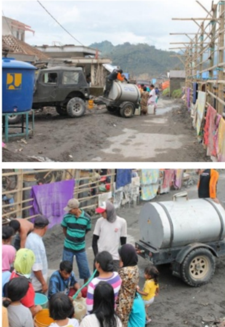
Gambar 8. Bantuan Air Bersih di Lokasi Terdampak