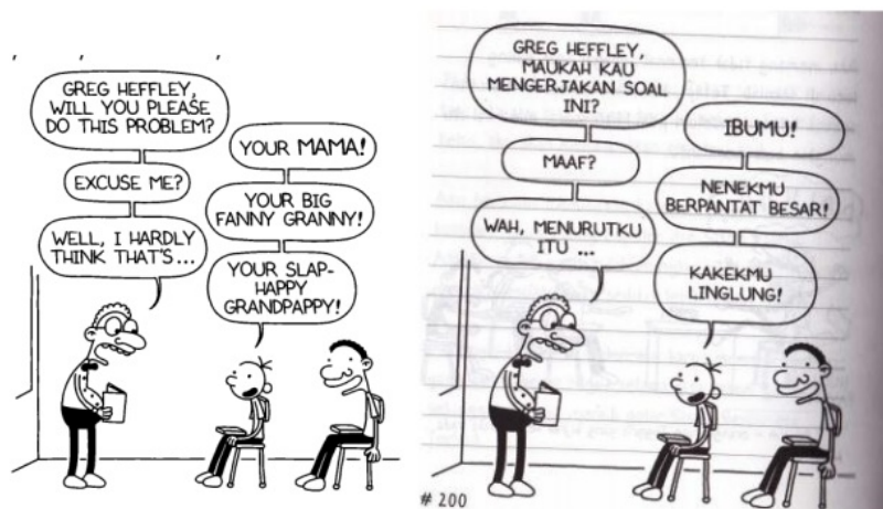
Gambar 1. Versi asli dan terjemahan dari permainan kata

Pada kartun diatas humornya disebut sebagai hinaan, yaitu “ketika seseorang mentertawai sesuatu atau seseorang yang menunjukkan bahwa orang tersebut bodoh” (Longman Dictionary of Contemporary English -International Edition, 2004). Hinaan tersebut dalam bentuk permainan kata ‘your big fanny granny’, yaitu kata “fanny” (/ˈfæn.i/) and “granny” (/ˈgræn.i/). Dalam versi terjemahannya hal tersebut tidak muncul. Saran perbaikan terjemahan: