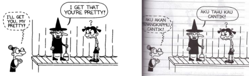
Gambar 2. Versi asli dan terjemahan dari kartun permainan kata