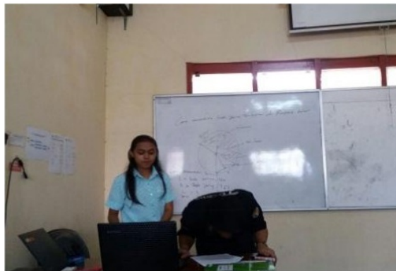
Gambar 3. Mahasiswa Praktik Menjelaskan Tampak Kurang Aktif dalam Kegiatan Belajar Mengajar

Selanjutnya diamati seorang mahasiswa di kelas yang diminta oleh temannya menjawab soal yang diberikan tampak pada Gambar 1. Menurut pengamatan, mahasiswa tersebut secara umum berperilaku sama seperti teman lainnya, namun jika diperhatikan mahasiswa tersebut kurang memperhatikan penjelasan yang disampaikan oleh temannya. Terlihat mahasiswa tersebut salah dalam menjawab soal yang diberikan. Mahasiswa kurang memahami aturan/langkah-langkah dalam menyelesaikan soal serta teknik dalam menulis