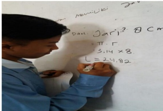
Gambar 2. Salah Satu Mahasiswa Mengerjakan Soal

menguasai konsep matematika serta kurang penguasaan dalam mengolah kegiatan belajar.