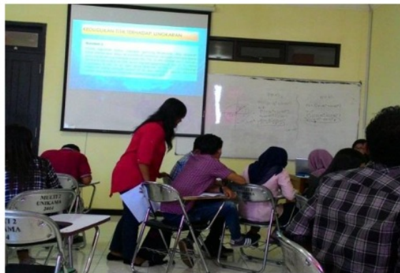
Gambar 4. Salah Satu Mahasiswa Menjelaskan Materi Melalui Media dan Pengelolaan Kelas Melalui Pembelajaran Berkelompok

Pengamatan tidak hanya dilakukan tiap individu saja, namun juga dilakukan pengamatan dalam tim/kelompok yang menyampaikan materi. Berdasarkan hasil pengamatan didapatkan fakta bahwa beberapa tim/kelompok dalam menyampaikan materi masih banyak membaca buku. Selain itu, isi yang disampaikan di depan kelas kurang mendalam. Mahasiswa masih terlihat malas untuk menjelaskan materi terlihat pada Gambar 3. Kurangnya kemampuan pengelolaan kelas juga terlihat, sehingga kegiatan pembelajaran kurang menarik dan terlihat monoton. Hal ini tentunya menunjukkan kurangnya pemahaman konsep mahasiswa akan materi.