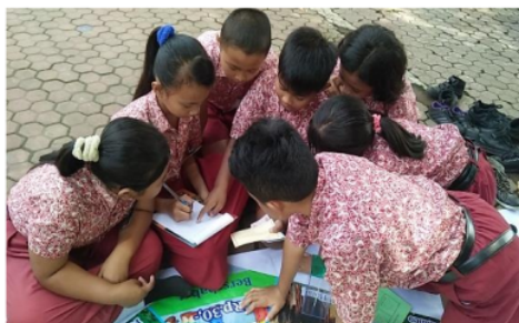
Gambar 3. Situasi Diskusi Kelompok

Guru mengingatkan K1 agar kembali ke kelompok untuk berdiskusi dan menuliskan jawaban pada LKK. Semua kelompok berdiskusi. Situasi diskusi disajikan pada gambar 3.