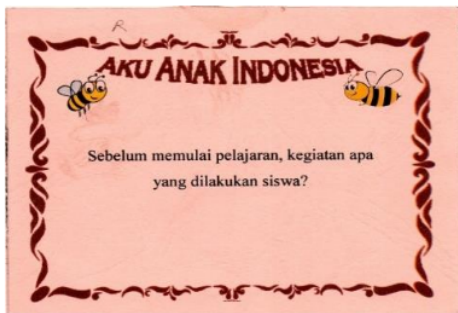
Gambar 4. Contoh Kartu AAI

Pada putaran III, kelompok 1 menempati petak pojok papan PMI yang bertuliskan “Peduli Sosial”. Kelompok 1 mengambil kartu AAI dan menjawab pertanyaan tersebut. Kartu AAI yang diperoleh kelompok 1 disajikan pada gambar 4.