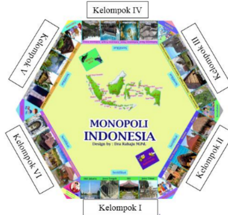
Gambar 1. Posisi Kelompok

Siswa sangat kagum melihat papan PMI yang berukuran 4 \times 4 m. Siswa juga memperhatikan kelengkapan PMI berbeda dengan permainan monopoli pada umumnya. Keberadaan media PMI dapat meningkatkan dan mengarahkan perhatian siswa (Arsyad, 2016). Guru memberi kesempatan siswa mengamati papan PMI. Setelah itu, guru meminta siswa berkumpul dengan kelompok yang dibentuk pada pertemuan sebelumnya. Siswa dibagi menjadi enam kelompok dan kelompok menempati sisi-sisi papan PMI. Posisi kelompok disajikan pada gambar 1.