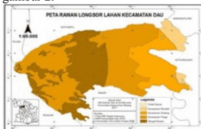
Gambar 2. Peta Rawan Longsor Lahan Kecamatan Dau

Setelah peta-peta parameter rawan longsor lahan dioverlay menjadi peta rawan longsor lahan seperti pada gambar 2.