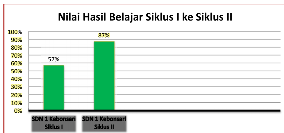
Grafik 2. Perbandingan Nilai Hasil Belajar Siklus I dan Siklus II di SDN 1 Kebonsari

Perubahan kebiasaan siswa yang awalnya pasif berubah menjadi aktif, juga merupakan faktor penting yang mempengaruhi meningkatnya keaktifan siswa pada siklus II. Hal itu disebabkan siswa termotivasi dengan model pembelajaran card sort . Dibuktikan dengan nilai hasil belajar yang mengalami kenaikan dari siklus I ke siklus II. Perbandingan nilai hasil belajar di SDN 1 Kebonsari dari siklus I ke siklus II disajikan dalam distribusi frekuensi bentuk Grafik 2 berikut.