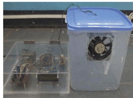
Gambar 5. Alat Pengontrol Emisi Gas Amonia

Hal ini disebabkan karena amonia yang menguap membutuhkan waktu penguapan untuk mencapai nilai tertinggi. Setiap alat ukur memiliki sensitifitas pengukuran. Setelah dilakukan pengukuran sampel cairan amonia dapat dicari nilai sensitifitas alat ukur menggunakan persamaan yang didapat dari pengukuran. Alat ukur yang telah dibuat memiliki sensitifitas pengukuran nilai terendah 0,1 ppm dan nilai tertinggi 58,7 ppm. Sensor membaca kadar amonia lebih dari 5 ppm maka mikrokontroler akan memberikan tindakan berupa sinyal high pada relay sehingga kontak pada relay akan bergerak menempel pada kondisi tertutup sehingga tegangan dapat mengalir menuju kipas/blower sehingga kipas akan berputar dan mengurangi kadar amonia di dalam kandang tersebut. Ketika kadar amonia terkurangi maka sensor akan membaca dan apabila pembacaan sensor di bawah 5 ppm maka mikrokontroler akan memberikan tindakan berupa sinyal low pada relay sehingga kontak pada relay akan bergerak menuju kondisi terbuka sehingga tegangan tidak dapat mengalir sehingga kipas/blower berhenti berputar.