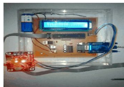
Gambar 3. Rangkaian Keseluruhan Alat Pendeteksi Gas Amoniak

Penelitian ini bertujuan untuk merealisasikan alat pengontrol emisi gas amonia dalam kandang di peternakan ayam menggunakan sensor gas MQ 137 dengan mikrokontroler ATMEGA 16 sebagai pengendali dan hasil pengukurannya ditampilkan dalam LCD M1632. Perangkat keras sistem akuisisi data serta rangkaian simulasi alat pengontrol emisi gas amonia dalam kandang ditunjukkan pada Gambar 2. Alat pengontrol gas amonia ini terbagi menjadi dua sistem kerja, yang pertama yaitu alat ukur kadar amonia, yang kedua yaitu alat pengontrol kadar ammonia dalam kandang ayam..