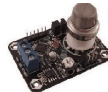
Gambar 1. Sensor Gas amonia

mikrokontroler dengan menambahkan satu buah resistor saja (berfungsi sebagai pembagi tegangan / voltage divider). Gambar 2 Sensor Gas MQ-135